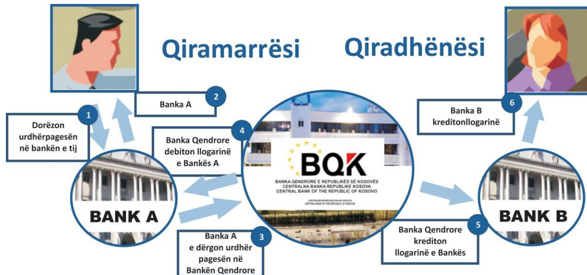
Figura 1 . Transferimi i fondeve nga llogaria e qiramarrësit te qiradhënësi

Sistemet e pagesave si tërësi pasqyrojnë instrumentet, procedurat dhe gjithë infrastrukturën për transfer parash përmes llogarive bankare. Çdo instrument pagese përmban në vetvete një numër hapash dhe procedurash për transferimin e fondeve përmes llogarive bankare. Këta hapa sigurojnë se pagesat kryhen ashtu siç duhet, shpejt dhe sigurt.